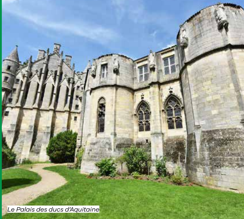
Le Palais des ducs d'Aquitaine