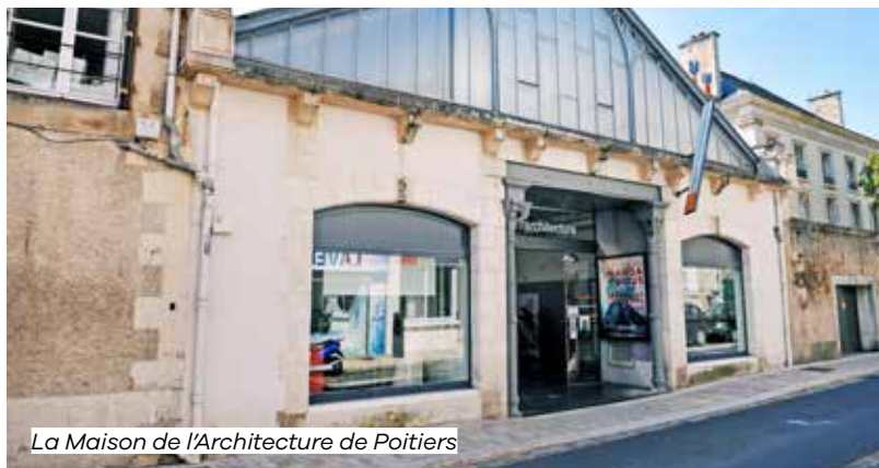
La Maison de l'Architecture de Poitiers

Découvrez cette architecture de la fin du 19 e siècle, une réhabilitation d'un ancien garage en lieu culturel, un des rares réemplois de bâtiment industriel en centre-ville de Poitiers.